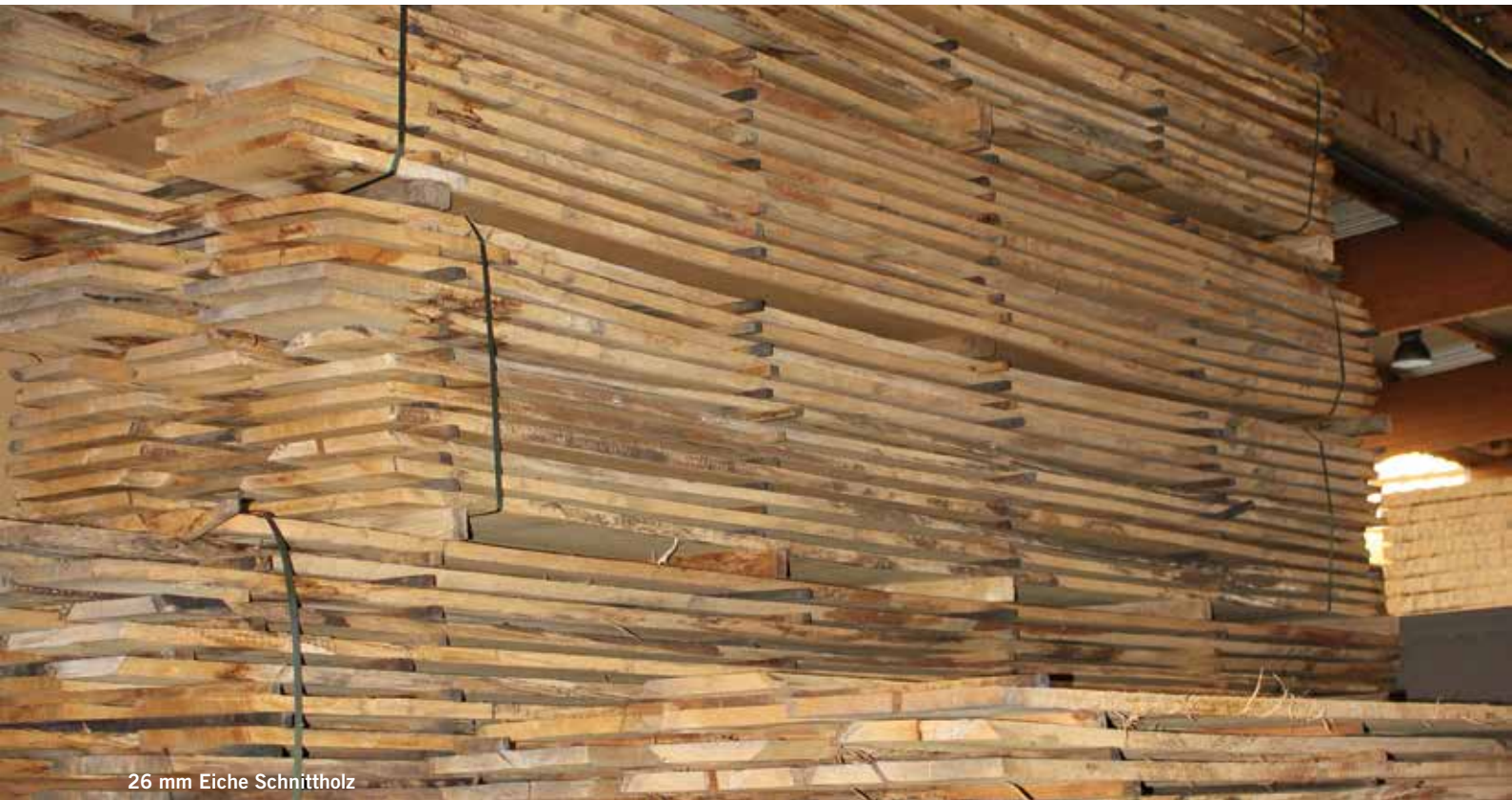
26 mm Eiche Schnittholz