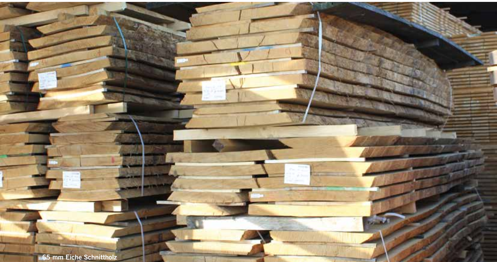
65 mm Eiche Schnittholz