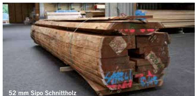
52 mm Sipo Schnittholz

Abura | Afromosia | Amazakoue (Ovenkol) | Ayous | Bete | Bilinga | Bubinga | Dibetou | Doussie | Ebiara | Framire | Iroko | Limba | Niangon | Makore (Douka) | Movingue | Padouk | Sapeli | Sipo | Wawa | Wenge | White Ofram | Zebrano (Rift/Halbrift)