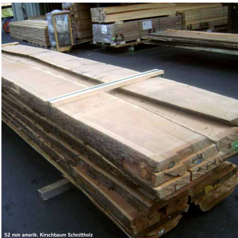
52 mm amerik. Kirschaum Schnittholz