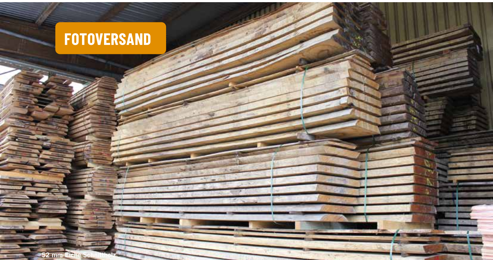
52 mm Eiche Schnittholz