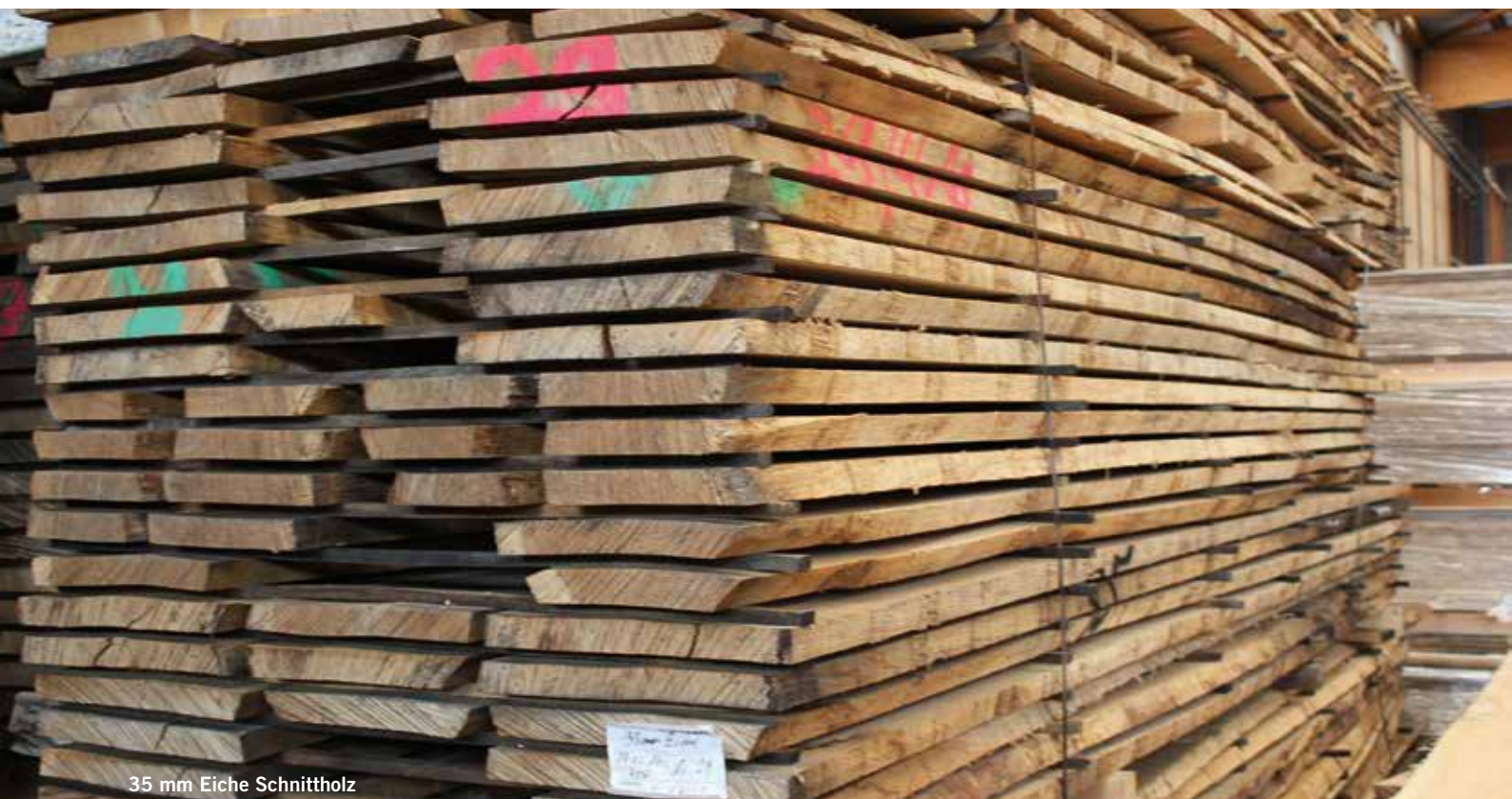
35 mm Eiche Schnittholz