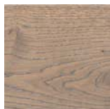
Landhausdielen 4V EICHE TABAKGRAU SAUVAGE retro strukturiert Art.Nr. 530 795