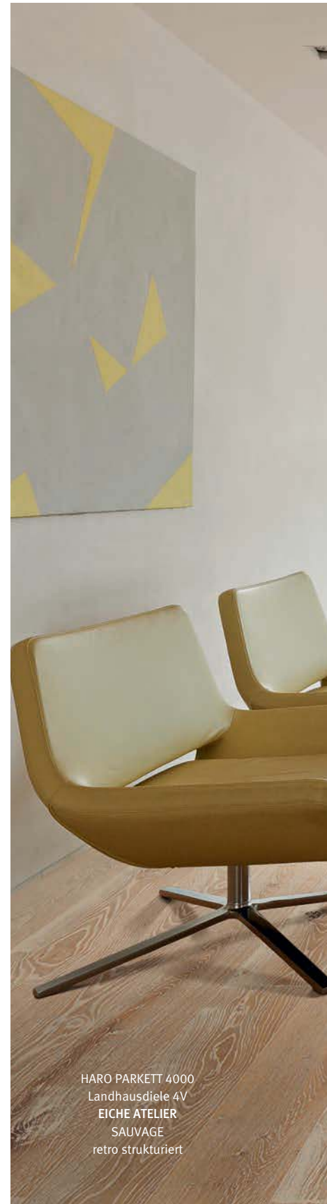
HARO PARKETT 4000 Landhausdielen 4V EICHE ATELIER SAUVAGE retro strukturiert