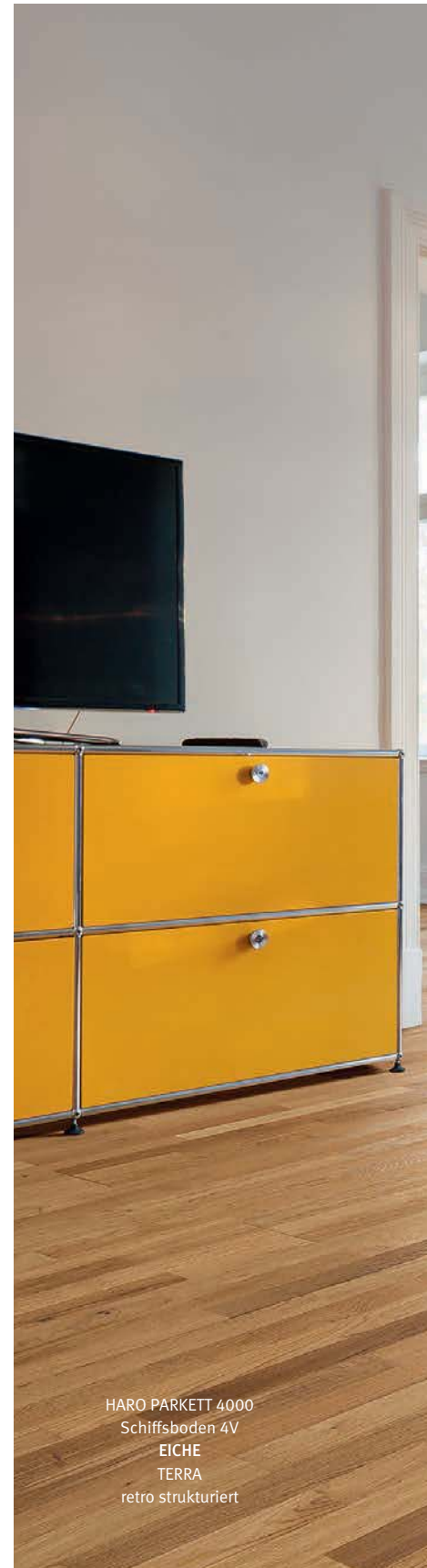
HARO PARKETT 4000 Schiffsboden 4V EICHE TERRA retro strukturiert

Schiffsboden und Eiche – klassischer geht es kaum, dafür umso trendiger. Ausgestattet mit unserer Oberfläche retro strukturiert 3D entfaltet dieses edle Parkett-Design mit den drei nebeneinander liegenden Lamellen ein erstaunliches Eigenleben. Mit der besonders starken Strukturierung, den natürlichen Vertiefungen und erhabenen, gewachsenen Ästen sehen die Dielen aus wie ein über Jahrzehnte benutzter Holzboden. Die umlaufende Fase jeder einzelnen Lamelle erzeugt eine ursprünglich-rustikale und doch moderne Optik.