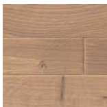
Schiffsboden 4V EICHE WEISS TERRA retro strukturiert 3D Art.Nr. 532 980