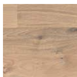
Schiffsboden EICHE WEISS TERRA retro strukturiert Art.Nr. 532 810