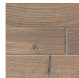
Schiffsboden 4V EICHE TABAKGRAU TERRA retro strukturiert 3D Art.Nr. 532 982