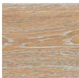
Landhausdielen 4V EICHE ATELIER SAUVAGE retro strukturiert Art.Nr. 531 764