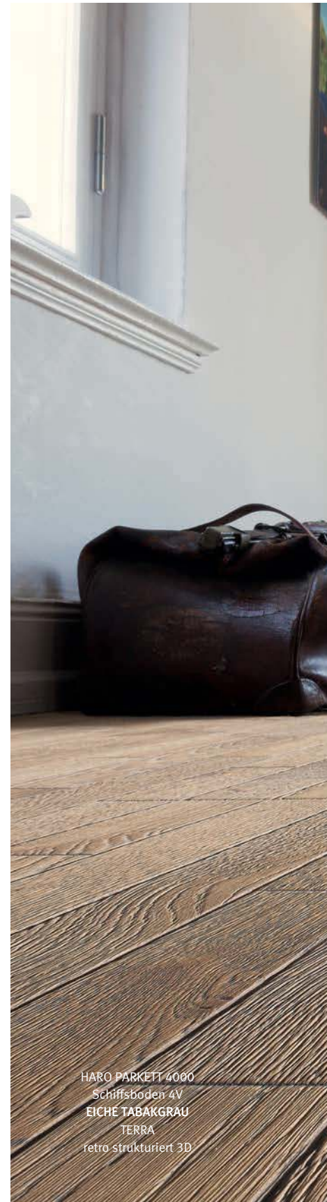
HARO PARKETT 4000 Schiffsboden 4V EICHE TABAKGRAU TERRA retro strukturiert 3D

Wo Dielen ihre eigenen Geschichten erzählen, dort fühlt man sich zuhause. Zum Beispiel in Räumen mit unserem Schiffsboden Eiche und der neuen Oberfläche Retro strukturiert. Sie zeigt die Optik von jahrelang in Gebrauch befindlicher Dielen wie z.B. in alten Schulhäusern. Natürlich matt, faszinierend realistisch mit natürlichen Vertiefungen wie bei den retro strukturierten Oberflächen, die man bereits von Landhausdielen und Schiffsböden kennt, ist der Schiffsboden retro strukturiert ein Höhepunkt der Authentizität. Aufwendige Verfahren und unsere Liebe zum Holz lassen jede Diele ihre eigene Geschichte erzählen. Ein Schiffsboden mit dem Charme der vergangenen Zeiten, trendig-rustikal und doch zeitlos modern.